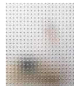
Ornamentglas Mastercarré weiß

Außen farbig Feinstruktur (Basaltgrau, Anthrazitgrau), innen weiß.