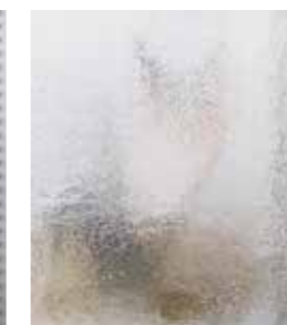
Ornamentglas Chinchilla weiß