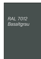
RAL 7012 Basaltgrau